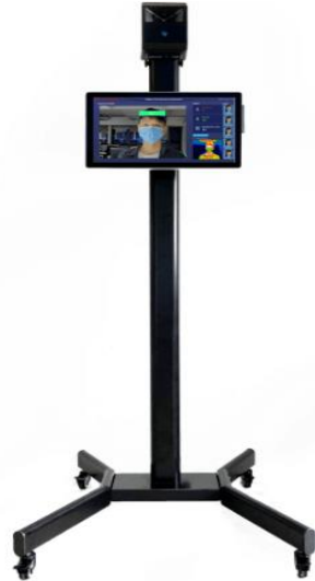
検温用サーモグラフィ