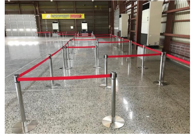
ベルトパーテーション