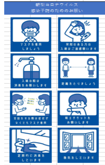
ポスターなどの掲示